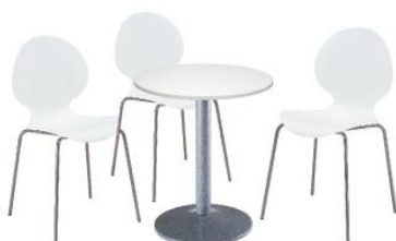
Pack B 137 € HT