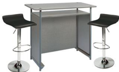
Kit 1 204 € HT